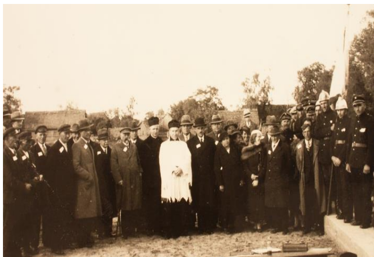
Uroczyste poświęcenie fundamentów pod budowę szkoły